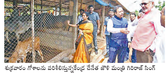
శుక్రవారం గోశాలను పరిశీలిస్తున్న కేంద్ర వేనేట్ జాళి మంత్రి గిరిరాజ్ సింగ్

రాష్ట్రంలో పత్తి ఉత్పత్తి పెంచేందుకు చర్యలు మొత్తం రూ. 11 వేల కోట్ల ప్రాజెక్టులతో ఎపికి అధిక భాగస్వామ్యం ఎగుమతులు, మౌలిక వసతుల్లో పురోగతి: కేంద్ర జాళి మంత్రి గిరిరాజ్ సింగ్